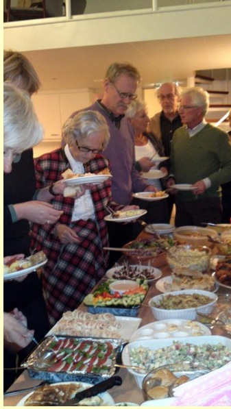
Tenslotte een overheerlijk buffet uit eigen keuken.