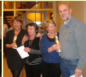
zij redden de eer van Brid-ge-noten