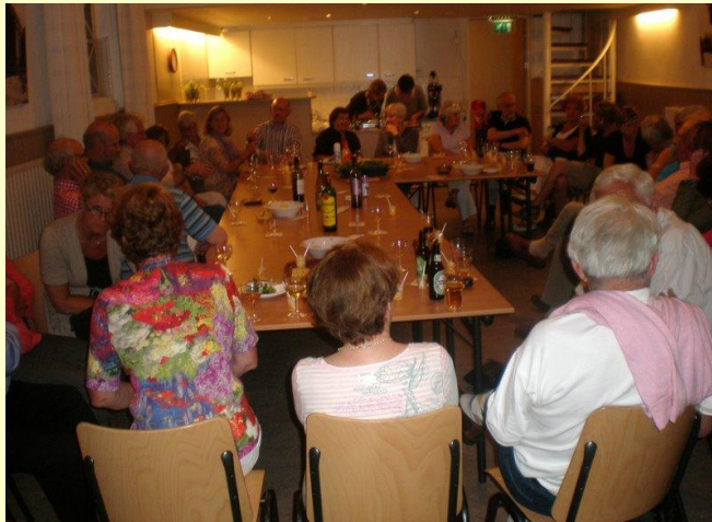
Gevulde eieren, advocaatje met slagroom .... het was weer ouderwets gezellig!