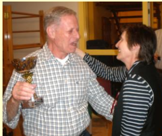
de beker blijft bij BCL