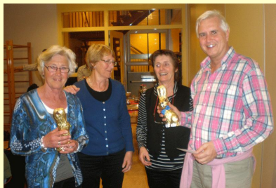
de beste BCL-ers

Over de uitslag was hier en daar wel wat ontevredenheid en dan vooral bij Brid-ge-noten, die weer op aarde terug waren. Als je toch meer wilt weten kijk dan naar de complete uitslag .